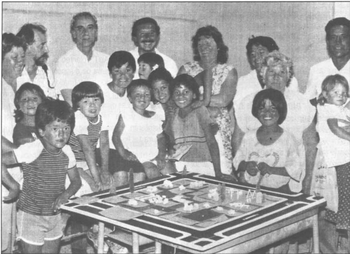
Vecinos y técnicos diseñando la plaza de San Felipe