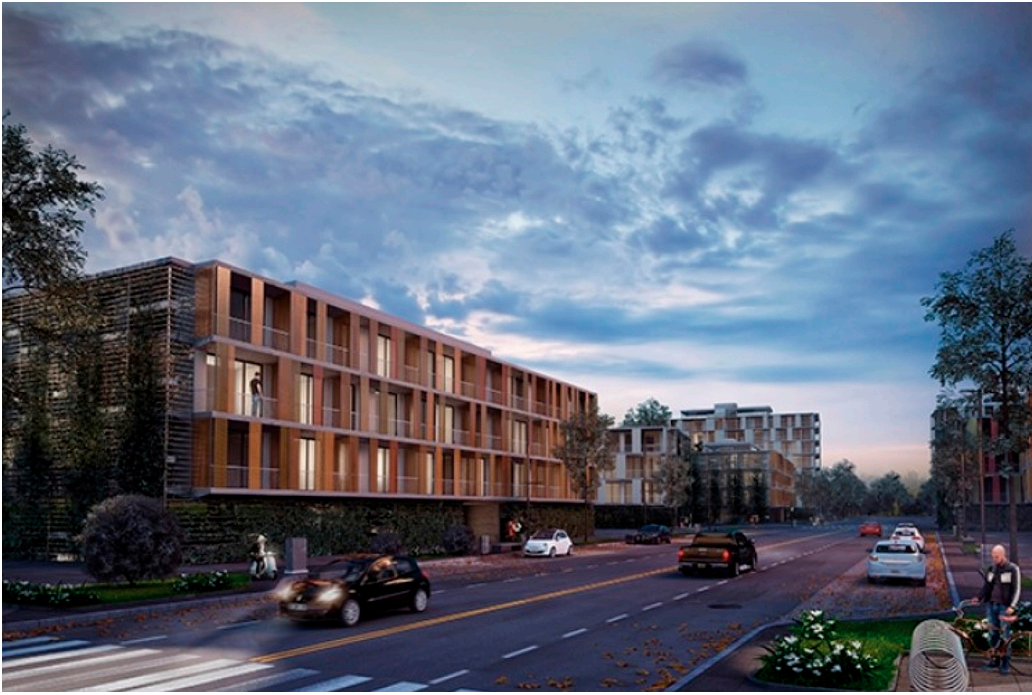
Figura 4 Proyecto Sector D ex Batallón 121.