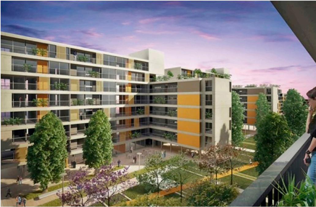
Figura 2 Proyecto Parque Habitacional Tiro Federal.

Las viviendas serán de uno, dos y hasta tres dormitorios, con una superficie entre 40 m 2 y 80 m 2 . Estas se distribuyen según los siguientes números: 32 de un dormitorio, 288 de dos dormitorios y 32 de tres dormitorios. También se destina un área de estacionamiento para 230 automóviles. Cabe señalar que solamente 42 viviendas serán sorteadas para el crédito Pro.Cre.Ar. y el total restante será comercializado por el desarrollador en el mercado, destinando solo el 12% para vivienda e infraestructura básica. Este cambio sobre el proyecto original que contemplaba que todas las viviendas fueran para beneficiarios del programa, fue fuertemente criticado por algunos sectores que señalan que el Estado le cede tierras al sector privado. Además, los críticos aseguran que la compensación es mínima a cambio de un negocio millonario. Finalmente las obras se iniciaron a mediados del año 2019, fijando el municipio un plazo máximo de entrega de 36 meses para la totalidad de las unidades terminadas. Actualmente, las tareas que se están realizando son la nivelación de suelos entre las vías del ferrocarril (Valentín Gómez y Zelaya), para empezar a construir la nueva sede del club, y la demolición de la cancha de pádel. Además, se están llevando adelante los trámites ante la Municipalidad para obtener la aprobación de la apertura de las calles laterales (Pellizón, 2019).